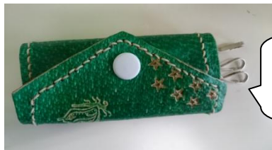
皮革工芸 キーホルダー

高等部は皮革工芸、木工、窯業、縫製・織物、基礎作業（リサイクル活動、農耕）に分かれています。出来上がった製品は文化祭や授業参観の時に販売しています。また、校外での販売活動も計画しています。